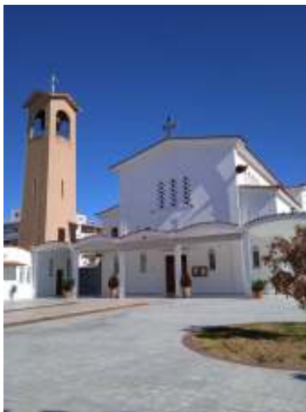
Εικόνα 4. Ο ιερός Ναός της Κοιμήσεως της Θεοτόκου του Συνοικισμού (Ιωνίας) Κορίνθου όπως είναι σήμερα.

Ο Οργανισμός Αποκαταστάσεως Προσφύγων, το 1927-1928 απαλλοτρίωσε την περιοχή του μικρού λόφου Β.Α. της πόλης της Κορίνθου, το κράτος παραχώρησε οικόπεδα και έχτισαν “μπαγδαντί” σπιτάκια με δύο καμαρούλες και υπόγειο. Ο Μεγάλος Συνοικισμός Κορίνθου «Άγιος Σπυρίδωνας» άρχισε να χτίζεται από τα τέλη του 1927 και ολοκληρώνεται ουσιαστικά μετά το μεγάλο σεισμό της 22ας Απριλίου 1928.