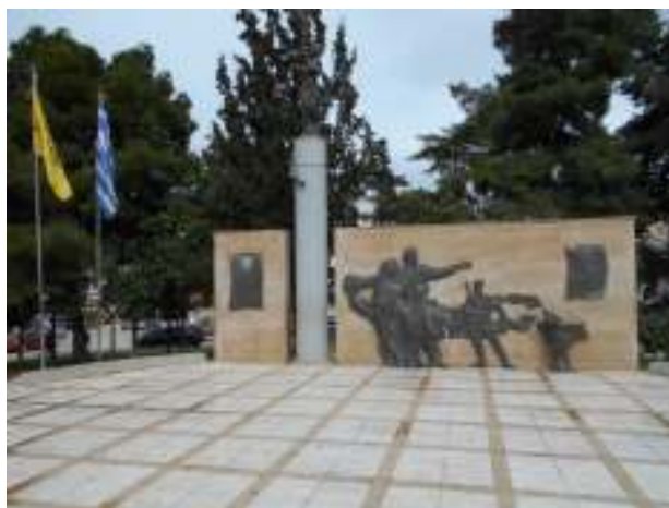
Εικόνα 1. Πανοραμική άποψη του Μνημείου των Μικρασιατών Προσφύγων του Συνοικισμού (Ιωνίας) Κορίνθου και της πλατείας Σταύρου Ηλιόπουλου, όπου κάθε Σεπτέμβριο πραγματοποιούνται εκδηλώσεις μνήμης από τη Μικρασιατική Στέγη Κορίνθου.

Οι περιοχές της Μικράς Ασίας και του Πόντου (όπως και η Ευρώπη του Νότου, η χερσόνησος του Αίμου, η Βόρειος Αφρική κ.ά.) είναι διάσπαρτες από Αρχαίους Ελληνικούς και Ρωμαίικους Ορθόδοξους Ναούς, θέατρα και κτίσματα. Στα Πανεπιστήμια και στα Μουσεία της Δύσης και της Ανατολής (Μ. Βρετανία, Γαλλία, Γερμανία, Η.Π.Α., Τουρκία, Ρωσία, Αίγυπτος κ.ά.) βρίσκονται Αρχαίοι Ελληνικοί Πάπυροι και Ρωμαίοι Κώδικες, έργα Τέχνης και Κειμήλια ανυπολόγιστης πνευματικής και οικονομικής αξίας. Ένα μεγάλο μέρος της σύγχρονης τεχνολογίας και επιστήμης παγκοσμίως, έχει τις απαρχές της στον Αρχαίο Ελληνικό και Ρωμαίο κόσμο. Κάθε χρόνο μελετώνται, ψηφιοποιημένα και μη, κείμενα Αρχαίων Ελλήνων Φιλοσόφων και Αγίων Πατέρων της Ορθόδοξης Ανατολικής Εκκλησίας και παράγονται πολλαπλές διδακτορικές διατριβές, βιβλία, άρθρα, κείμενα και εργασίες ανά τον κόσμο.