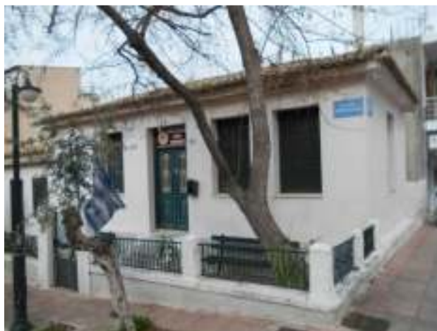
Εικόνα 7. Ένα από τα τελευταία διατηρημένα προσφυγικά σπίτια του Μεγάλου Προσφυγικού Συνοικισμού Κορίνθου στο οποίο στεγάζεται η Μικρασιατική Στέγη στη γωνία Κωνσταντινουπόλεως και Έρμου.

Το 1989 μετά από σύσκεψη στο 4 ο Δημοτικό Σχολείο του Συνοικισμού, όπως για εβδομήντα και πλέον χρόνια ονομαζόταν η περιοχή, κάτοικοι αποφάσισαν την ίδρυση Μικρασιατικού Σωματείου, με σκοπό την προβολή της καταγωγής και του πολιτισμού των κατοίκων της συνοικίας. Η Μικρασιατική Στέγη Κορίνθου λειτούργησε επίσημα το 1992.