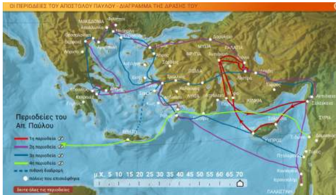
Εικόνα 3. Οι Περιοδείες του Αποστόλου Παύλου στο https://photodentro.edu.gr/v/item/ds/8521/8342 (ανακτήθηκε από το διαδίκτυο, 13-2-2022).

Στη Μικρά Ασία, στον Ελλαδικό και στον Ευρωπαϊκό χώρο περιοδεύει ο Απόστολος Παύλος: