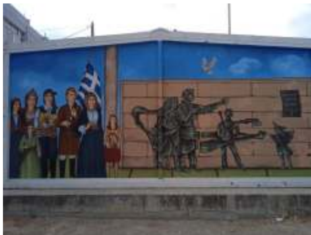
Εικόνα 6. Ζωγραφική σύνθεση εμπνευσμένη από το Μνημείο Μικρασιατών προσφύγων της πλατείας Σταύρου Ηλιόπουλου στο Συνοικισμό Κορίνθου στο προαύλιο του 4 ου Γυμνασίου Κορίνθου.

Τα καφενεία δίπλα στο Ναό Κοιμήσεως της Θεοτόκου, ήταν το σημείο συνάντησης και συναναστροφής των Μικρασιατών προσφύγων. Στις μεγάλες γιορτές στηνόταν μεγάλο γλέντι, όπως και στην Πατρίδα. Με ιδιαίτερη χαρά γιόρταζαν “Πάσχα του Καλοκαιριού”, τον Δεκαπενταύγουστο, όταν τιμούσαν την Κοίμηση της Υπεραγίας Θεοτόκου. Γύρω από τη Λεωφόρο Κορίνθου, νυν Ιωνίας, αναπτύχτηκε και το εμπορικό κέντρο του Συνοικισμού, έως σήμερα.